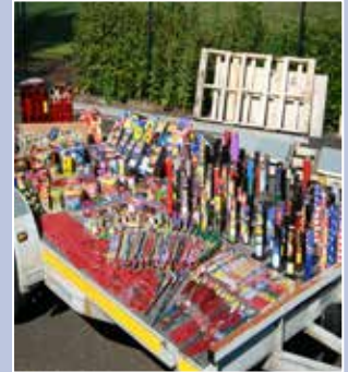
Las autoridades de Hillsboro confiscan cohetes ilegales como estos cada año.

Las autoridades de Hillsboro confiscan cada año cohetes y juegos pirotécnicos no legales.