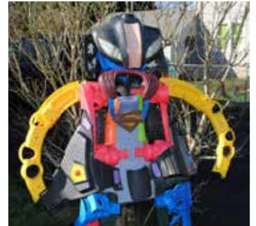
Trashformers, puesto de relieve en el evento Celebre Hillsboro, usa materiales reciclados, incluyendo una caja de sonido y un teclado de computadora.