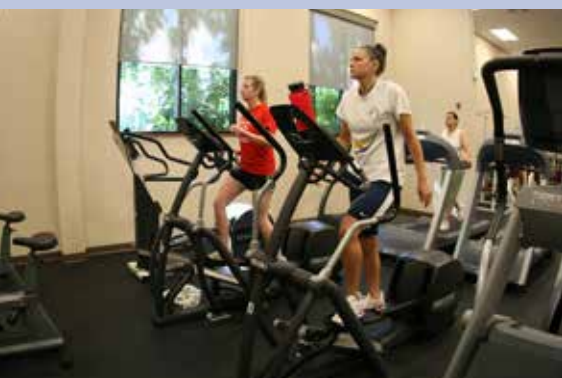
Los usuarios se ponen en forma usando el Cuarto Cardiopulmonar de SHARC.

Cuando usted atraviese por las puertas del Centro Recreativo Acuático del Parque Shute (SHARC, siglas en inglés), las dos albercas bajo techo, el cuarto jacuzzi y la alberca al aire libre podrán tentarlo para querer bañarse, pero SHARC es algo mucho más que un centro acuático.