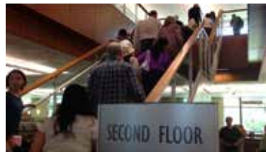
Los usuarios se apresuran a entrar al recién inaugurado segundo piso para disfrutar del nuevo espacio y sus amenidades.