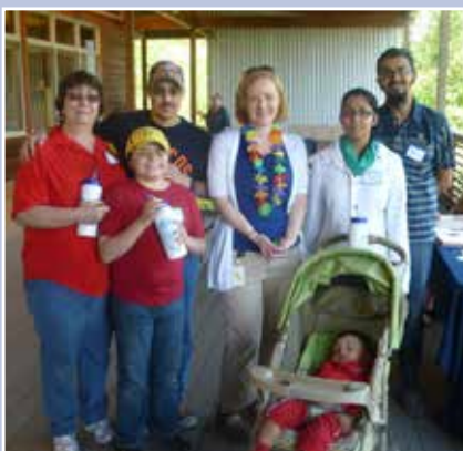
Los voluntarios se reúnen para ser reconocidos por sus esfuerzos en la Preservación de los Terrenos Pantanosos de Jackson Bottom.

Si usted pasara los próximos cinco años de su vida no haciendo otra cosa más que siendo voluntario de la Ciudad de Hillsboro—sin tomar tiempo para comer o dormir, y sin siquiera para leer este artículo—todavía se quedaría varios meses corto de igualar los miles de horas que los voluntarios dedicados de Hillsboro contribuyeron para la ciudad el año pasado.