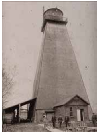
Una torre de madera para almacenar el agua de la ciudad en la década de 1890.

Ahora en el verano del 2013, Hillsboro continúa dando crédito a las personas cuya visión y esfuerzo condujeron al desarrollo laborioso de un sistema hidráulico capaz de ofrecer servicio público para satisfacer las necesidades de agua en la comunidad en el siglo 21. Durante los últimos 100 años, la ciudad ha ampliado y mejorado su sistema hidráulico varias veces, siempre mirando hacia el futuro, para ofrecer a sus clientes y empresas el agua necesaria para que prosperen.