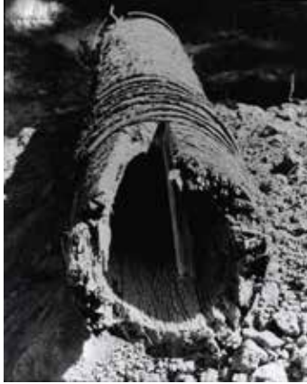
El tubo de madera que proporcionaba el agua a los habitantes de Hillsboro en 1913.

Era el año 1913, y un tubo de madera que venía desde la Cuenca Tualatin constituía el primer suministro público de agua para la Ciudad de Hillsboro. Solamente 63 años después, cuando la ciudad celebró su incorporación de un siglo antes, el encabezado de la Edición del Centenario de Hillsboro en 1976 del Argus reconoció el importante desarrollo, "Los Funcionarios Demuestran su Previsión en el Sistema del Agua".