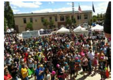
Las turbas del evento Celebre Hillsboro en el año 2012 aglomerándose en la Plaza del Centro Cívico.