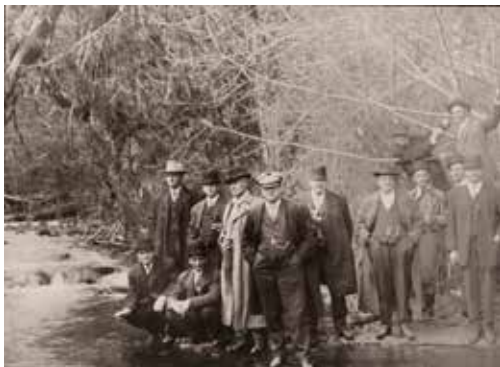
Abril 1912, el Alcalde de Hillsboro y los Concejales de la Ciudad en Sain Creek.

La agencia Hillsboro Water, o Agua de Hillsboro, proporcionó sus servicios a solo 2,000 clientes en 1913, cuando las proyecciones originales del sistema hidráulico eran de proporcionar servicio a una población hasta de 50,000 habitantes. Las adiciones construidas en las Presas Scoggins y Barney a principios de la década de 1970, al igual que la construcción de la Planta de Tratamiento de la Comisión Conjunta del Agua en 1976, incrementaron la capacidad del sistema de servicios hasta 400,000 clientes para beneficio de las comunidades de Hillsboro y de otras partes del Condado de Washington.