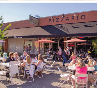
Calle Main y Avenidas