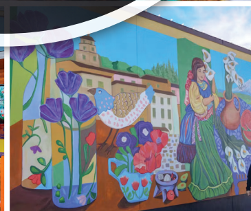
Calle Diez/10 o Avenida