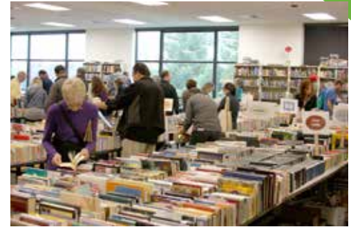
Usuarios examinan detenidamente las mesas llenas de libros y de otros artículos durante la Venta de Libros de los Amigos de la Biblioteca que se llevó a cabo en noviembre.

Con la ayuda de 200 voluntarios que donaron más de 2,000 horas colectivamente de su tiempo, los Amigos de la Biblioteca Pública de Hillsboro en su venta de noviembre consiguieron un nuevo record al lograr casi $55,000 dólares en ventas. El dinero recaudado se utilizará para comprar materiales, incluyendo un kiosco de alfabetización de temprana edad para la Biblioteca Principal, y libros y DVDs para la Biblioteca del Parque Shute que pronto se va a abrir. A un precio promedio de $1.50 por artículo, más de 36,000 libros, videos y otras cosas encontraron nuevos hogares. Una vez más, los libros para niños fueron los que se vendieron como pan caliente. Los libros que no se vendieron fueron ofrecidos a agencias no lucrativas y educadores, incluyendo la Escuela Secundaria Century y el Proyecto Conectando a Personas Sin Hogar. Los artículos que se no vendieron se conservarán para la próxima venta o se mandarán a reciclar. La próxima venta de libros de los Amigos de la Biblioteca Pública de Hillsboro se llevará a cabo del 2 al 11 de mayo.