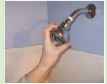
Instale una regadera ahorradora de agua para reducir la cantidad de agua que utiliza al bañarse.

Asegúrese de tomar ventaja de la ayuda gratuita en el alto costo de las facturas de energía y agua. El Departamento del Agua en Hillsboro se ha asociado con la compañía Energy Trust de Oregon para llevar a cabo el programa de Evaluaciones de Energía diseñado para ayudar a los clientes a encontrar maneras fáciles y baratas de reducir el consumo de agua y energía—resultando así en facturas más económicas por los servicios públicos.