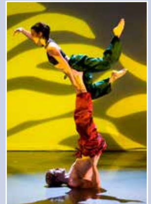
BodyVox en concierto.

Visite el sitio Web Hillsboro-Oregon.gov/Walters para informarse de la lista completa de los futuros conciertos y matinés familiares.