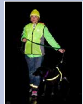
Como se ilustra en estas fotos, la joven a la derecha, que lleva ropa reflectante, es mucho más visible en la noche oscura y lluviosa.