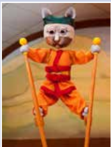
Malika, Reina de los Gatos, actuada por el Teatro Lágrimas de Alegría (Tears of Joy).

con una selección siempre cambiante de artistas de gran talento—desde músicos mundialmente famosos de jazz, hasta compañías de danza moderna, y nuestros queridos artistas locales populares: siempre hay algo para el gusto de todos.