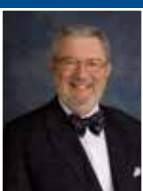
Concejala Fred Nachtigal

Nuestros oficiales públicos de seguridad.