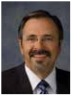
Alcalde Jerry Willey

¿De qué servicio de la Ciudad se siente usted más agradecido en el 2014?