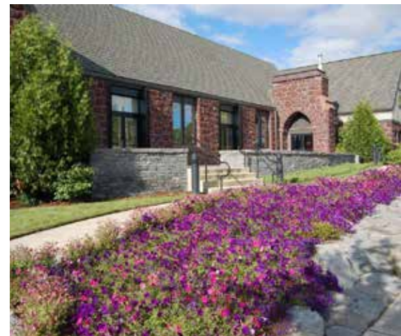
El Centro Cultural Artístico Walters.

Cuando uno vive en Hillsboro, nuestra familia no necesita ir tan lejos para encontrar entretenimiento en vivo. Contamos con actuaciones críticamente aclamadas por parte de Bag & Baggage,