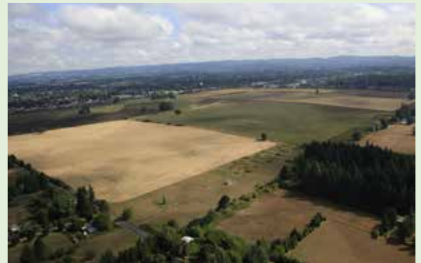
El área Sur de Hillsboro se encuentra al sur de la Carretera TV Highway entre las Avenidas 209 y 229.

A lo mejor su familia decidirá moverse al área del Sur de Hillsboro algún día, o simplemente vaya a gozar de sus parques públicos, veredas y espacios verdes. Usted podría conocer a algún trabajador que venga a Hillsboro todos los días de algún lugar lejano, y usted podrá decirle que podrá contar con nuevas opciones de vivienda familiar en el área del Sur de Hillsboro.