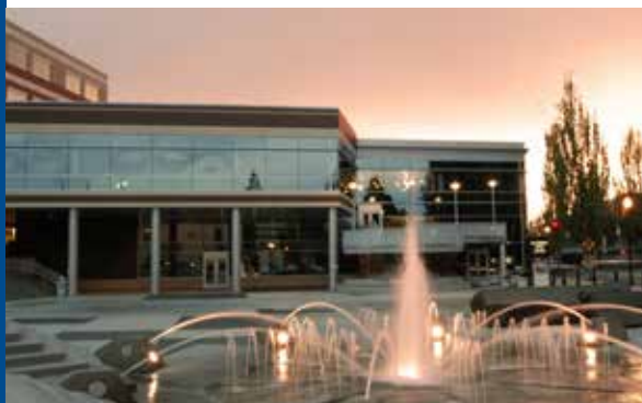
La Plaza del Centro Cívico Tom Hughes.

Al mismo tiempo, los espacios al aire libre de Hillsboro ayudarán a las familias a disfrutar otro verano muy emocionante. El Complejo Recreativo Gordon Faber auspicia competencias muy emotivas deportivas para todas las edades. Los fanáticos del béisbol de todas las generaciones pueden observar a los Campeones de la Liga del Noroeste, los Hops o Lúpulos de Hillsboro