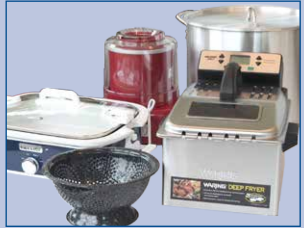
Los utensilios de cocina entre las Cosas de la Biblioteca.

Los artículos de las Cosas de la Biblioteca se pueden llevar prestados durante siete días, pero no se pueden renovar. Use las palabras clave "library of things" (biblioteca de cosas) para examinar el catálogo de la biblioteca en www.wccls.org , y si se han llevado ya un artículo, usted lo puede poner en lista de espera si lo solicita. Usted también puede sugerir algún artículo para las Cosas de la Biblioteca enviando un correo electrónico a hplill@hillsboro-oregon.gov .