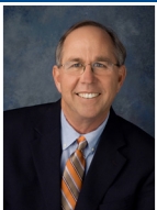
President de Concilio Steve Callaway Periódicos de todo el país