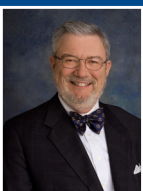
Concejala Fred Nachtigal "A Tale of Two Cities" (Una Historia de Dos Ciudades) de Charles Dickens