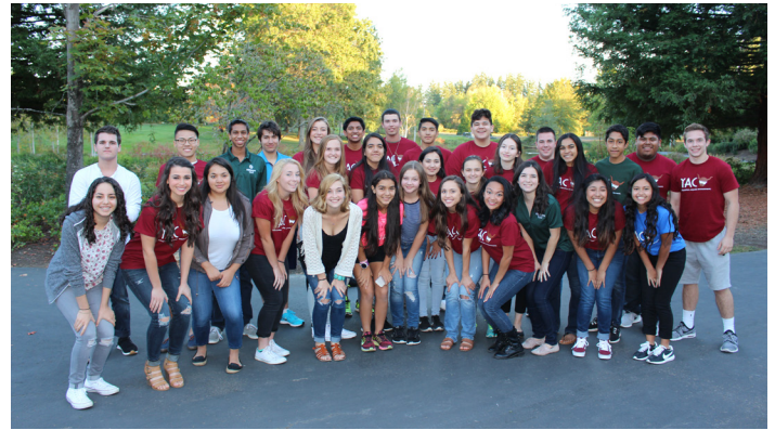
Miembros del Concilio Asesor Juvenil (YAC, siglas en inglés) del 2015-2016.

Los miembros de YAC forman un grupo creativo diverso, trabajan duro, y son estudiantes entusiastas. Los estudiantes que sean aceptados en YAC se espera que asistan por lo menos de 5 a 7 reuniones el segundo y cuarto martes de cada mes. Los estudiantes también se espera que participen en los proyectos de servicio comunitario cada mes y asistan a reuniones especiales ocasionalmente. Si usted está listo para pertenecer a YAC, las solicitudes deben entregarse a más tardar el 15 de abril y se encuentran en línea en Hillsboro-Oregon.gov/YAC .